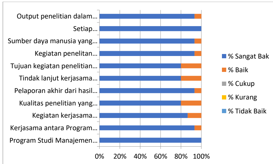
Grafik 2. Pengukuran Kepuasan Mitra Penelitian

Sedangkan pengukuran kepuasan mitra Pengabdian kepada Masyarakat dapat dilihat pada Grafik 3, dimana memperoleh tingkat kepuasan Sangat Baik dimana persentasinya rata-rata diatas 85%.