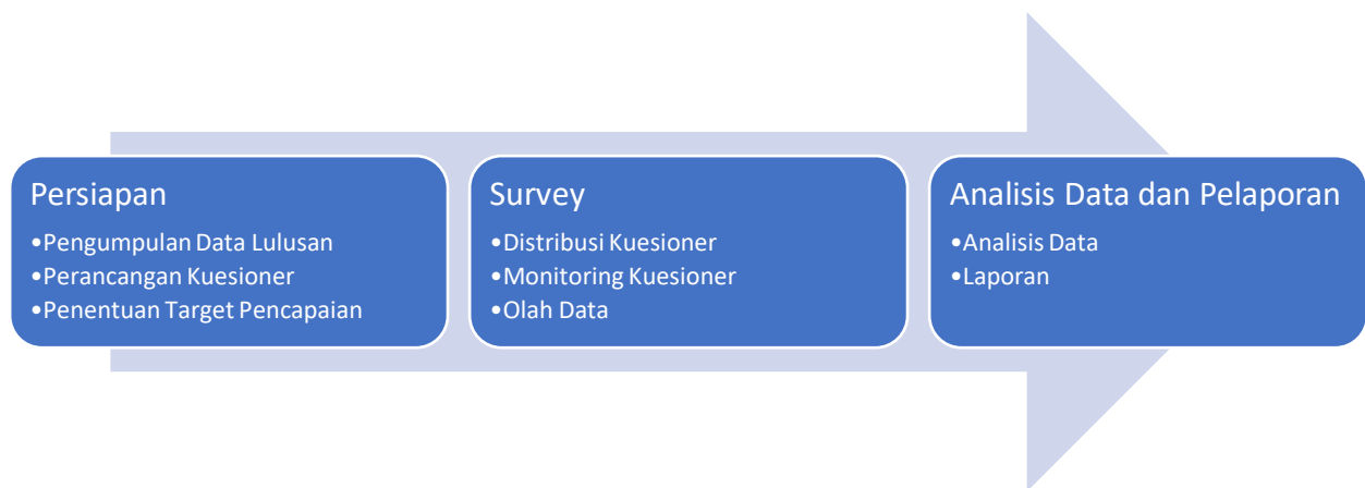
Gambar 3. Metodologi Tracer Study

Pada tahapan persiapan, pengumpulan data lulusan dilakukan dengan menghimpun data lulusan dari Biro Akademik yang dilanjutkan dengan penentuan target pencapaian responden. Berikutnya mempersiapkan kuesioner dengan menyesuaikan sesuai kuesioner standar Belmawa DIKTI yang dapat diakses pada laman https://tracerstudy.kemdikbud.go.id