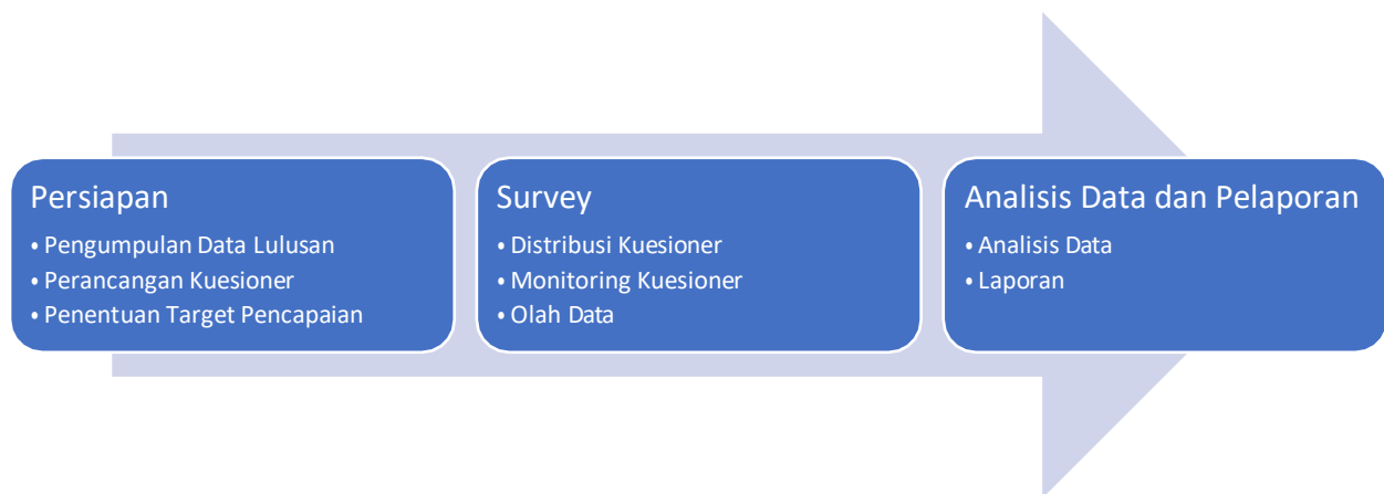
Gambar 3. Metodologi Tracer Study

Pada tahapan persiapan, pengumpulan data lulusan dilakukan dengan menghimpun data lulusan dari Biro Akademik yang dilanjutkan dengan penentuan target pencapaian responden. Berikutnya mempersiapkan kuesioner dengan menyesuaikan sesuai kuesioner standar Belmawa DIKTI yang dapat diakses pada laman https://tracerstudy.kemdikbud.go.id